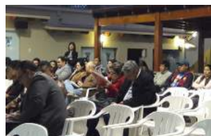
Nuestros Asociados en plena Asamblea