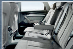
SEGURIDAD Y EQUIPAMIENTO